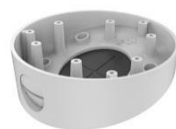
DS-1281ZJ-DM23 Скошенный потолочный кронштейн